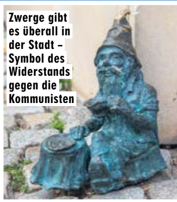
Zwerge gibt es überall in der Stadt - Symbol des Widerstands gegen die Kommunisten