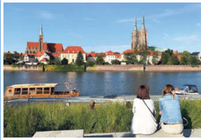
Toller Blick auf die Kathedrale: An der Oder wurde die Uferpromenade neu gestaltet

Der Große Ring ist der mittelalterliche Marktplatz mit bunten Bürgerhäusern