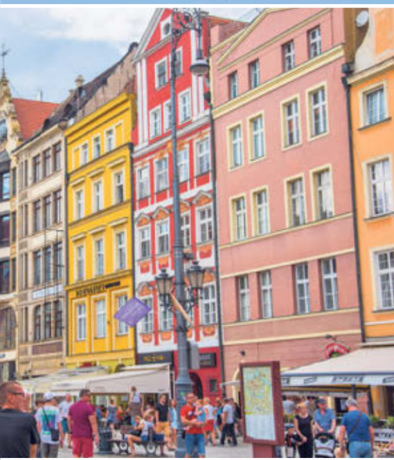
Polen gilt als das katholischste Land Europas ▼