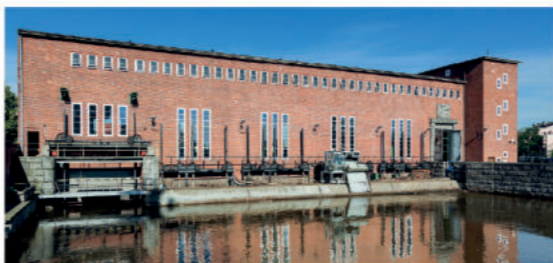
Elektrownia Wodna I