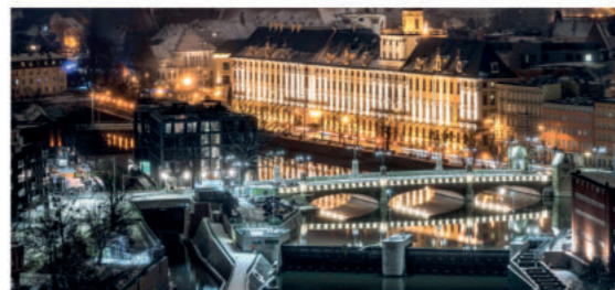
Mosty Pomorskie

Spacerując uliczkami Starego Miasta, w pobliżu gmachu Uniwersytetu z pewnością zwrócisz uwagę na pięknie odrestaurowane 7d mosty Pomorskie , które łączą jedną z odrzańskich wysp, Kępę Mieszczaną, ze stałym lądem. Przeprawę tworzą trzy mosty: Pomorski Północny, Południowy i Środkowy; najpiękniejszy z nich jest niewątpliwie Południowy. Został on zbudowany w 1905 r. w stylu neoromańskim z secesyjnymi detalami. Wykonane z piaskowca balustrady ozdobione 68 maszkaronami, wieżyczki z latarniami, klinkierowe tuki przęsł i strażnice od strony ul. Grodzkiej sprawiają, że jest to jeden z najpiękniejszych mostów Wrocławia. Jeśli uważnie przyjrzy się balustradom mostu Środkowego, dostrzeżesz otwory po kulach – ślady walk o Festung Breslau w czasie II wojny światowej.