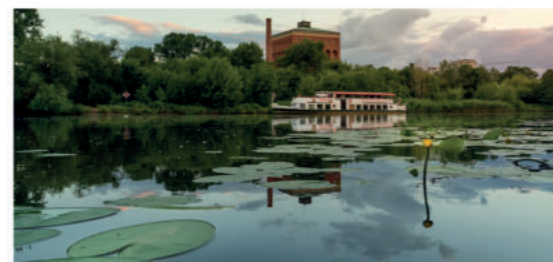
Bulwar Politechniki Wrocławskiej, widok na wieżę ciśnierni, fot. ze zbiorów WPM UMW

brzeże przystosowane jest do cumowania dużych i małych jednostek pływających. To także świetne miejsce na imprezy w plenerze, jak koncerty czy regaty. Z bulwaru widać gmach główny Politechniki, a tuż obok przycumowana jest barka, na której mieści się Fundacja Otwartego Muzeum Techniki. Po drugiej stronie Odry, przy ul. Na Grobli, znajduje się zabytkowa wieża ciśnierni, w oddali widać jaz Szczytniki, zwany też Zwierzynieckim. To także miejsce treningów krasnalowej ósemki ze sternikiem.