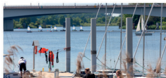
Marina Osobowice

Marina Osobowice to punkt, w którym można nie tylko zacumować jacht, ale także zaparkować camper. W marinie działają też tawerna, bar i wypożyczalnia sprzętu pływającego.