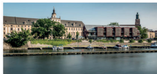
Marina Topacz

Marina Topacz położona jest w samym centrum miasta, przyjmuje jachty o długości do 15 m długości i jednego metra zanurzenia. Przystań jest wyposażona w węzeł sanitarny i miniwarsztat.