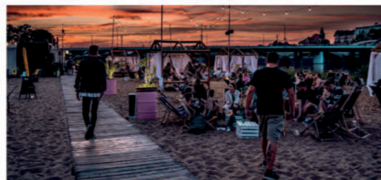
Jeden z wrocławskich beachbarów

Istnieje ich we Wrocławiu już kilkanaście. Czekają tam na Ciebie leżaki i hamaki, możesz też poleżeć na piasku, zjeść lunch i wypić drinka z pałeczką. Wiele plaż i beach barów oferuje także warsztaty jogi czy zumbi, możesz tam potańczyć i posłuchać muzyki. Niektóre plaże dysponują strefami zabaw dla dzieci i strefami sportowymi, gdzie pograsz w bule, badmintona czy siatkówkę plażową. Największa sztuczna miejska plaża, czyli HotSpot Beach Bar (ul. Wejherowska 34), ma aż kilkanaście tysięcy metrów kwadratowych. Znajdziesz tu leżaki i hamaki, a odpoczywać możesz w cieniu ogromnego parasola lub... palmy. Wieczorem HotSpot oświetlają nastrojowe lampy.