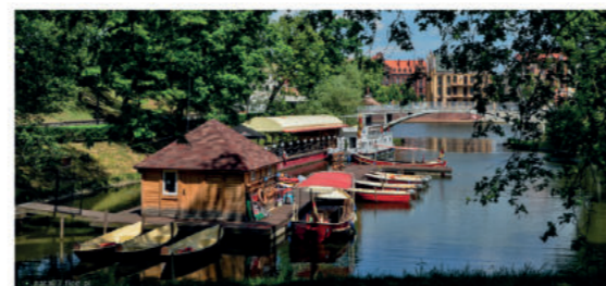
Zatoka Gondoli

Ta niewielka zatoka jest pozostałością dawnego ujścia lewego dopływu Odry. Możesz tu wypożyczyć sprzęt wodny lub wyruszyć w rejs statkiem po Odrze. Do dyspozycji masz turystyczny tramwaj wodny, 14-osobowy stateczek Arka, kajaki, łódzie wiosłowe i motorowe. To urokliwe, kameralne miejsce, otoczone zielenią, w którym warto się zatrzymać, wypić kawę i cieszyć się pięknym widokiem na Ostrów Tumski.