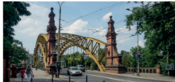
Most Zwierzyniecki

Spacerując uliczkami Starego Miasta, w pobliżu gmachu Uniwersytetu z pewnością zwrócisz uwagę na pięknie odrestaurowane 7d mosty Pomorskie , które łączą jedną z odrzańskich wysp, Kępę Mieszczaną, ze stałym lądem. Przeprawę tworzą trzy mosty: Pomorski Północny, Południowy i Środkowy; najpiękniejszy z nich jest niewątpliwie Południowy. Został on zbudowany w 1905 r. w stylu neoromańskim z secesyjnymi detalami. Wykonane z piaskowca balustrady ozdobione 68 maszkaronami, wieżyczki z latarniami, klinkierowe tuki przęsł i strażnice od strony ul. Grodzkiej sprawiają, że jest to jeden z najpiękniejszych mostów Wrocławia. Jeśli uważnie przyjrzy się balustradom mostu Środkowego, dostrzeżesz otwory po kulach – ślady walk o Festung Breslau w czasie II wojny światowej.