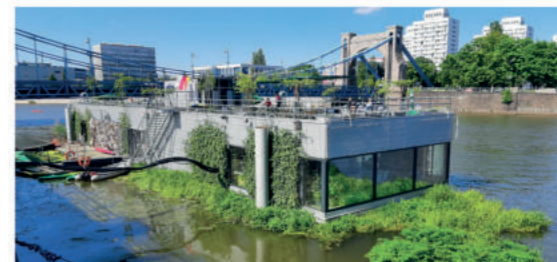
Odra Centrum

Niezwykłą rolę Odry w życiu Wrocławia poznasz, odwiedzając Odra Centrum – miejsce spotkań na wodzie, jedyny tego typu ośrodek edukacyjno-kulturalny w Europie. Odra Centrum mieści się na pływającej konstrukcji o powierzchni 800 mkw. Obiekt zacumowany jest w pobliżu zabytkowego mostu Grunwaldzkiego. Odra Centrum zajmuje się tematyką ekologii i ochrony środowiska naturalnego rzek i akwenów oraz podejmuje działania kulturalno-społeczne pod nazwą „Budujemy tożsamość Odrzan”. W ramach Odra Centrum działa również Szkoła na Wodzie, gdzie dzieci zdobywają wiedzę o rzece, jej historii, budownictwie wodnym, hydrologii, ekologii, odrzańskie flory i fauny. Znajdziesz tu także punkt informacji turystycznej na temat Odry, ODRATEKĘ, czyli bibliotekę, w której zgromadzono wszelkie materiały na temat Odry, oraz kawiarnię i punkt gastronomiczny.