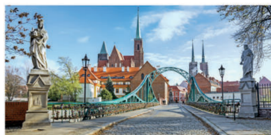
Most Tumski

Równie znany i chętnie odwiedzany jest 7b most Tumski , zwany także mostem Zakochanych, ponieważ zakochane pary przypinały niegdyś do mostu kłódki ze swoimi imionami, co miało zapewnić szczęście i trwałość związku. Ten niewielki mostek łączy wyspę Piasek z Ostrowem Tumskim. Przez wieki istniały w tym miejscu mosty drewniane, wielokrotnie niszczone, a obecna stalowa nitowana konstrukcja pochodzi z roku 1889.