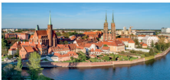
Ostrów Tumski

Ta dawna wyspa (słowo „ostrów” oznaczało niegdyś wyspę na rzece) nazywana jest historycznym i duchowym sercem miasta. Historycznym, bo to tu powstał pierwszy gród, który dał początek miastu. Duchowym, gdyż tutaj wybudowano pierwszy wrocławski kościół, tu powstała siedziba biskupstwa ustanowionego w roku 1000, które przetrwało do dziś. Ostrów Tumski ze swoimi niezwykłymi zabytkami jest jedną z największych atrakcji turystycznych miasta. Jeśli chcesz poczuć odrobinę magii, wybierz się tu tuż przed zachodem słońca, aby spotkać latarnika, który o zmierzchu, zupełnie jak 150 lat temu, zapala gazowe latarnie.