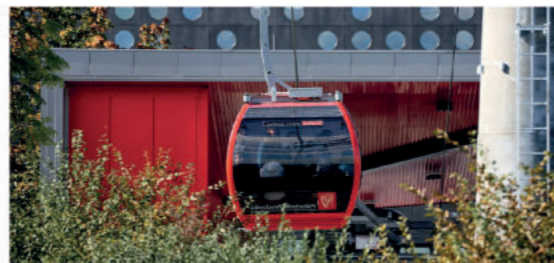
Polinka, fot. ze zbiorów WPM UMW

panoramę Wrocławia, z mostem Grunwaldzkim i Ostrowem Tumskim, bulwarami i wieżą ciśnierni.