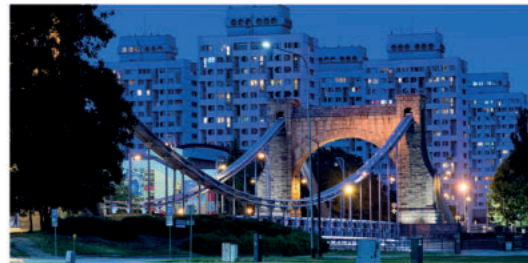
Most Grunwaldzki

Prawdziwą ikoną Wrocławia jest 7a most Grunwaldzki , który swoją popularność zawdzięcza nie tylko oryginalnej konstrukcji – jest mostem wiszącym – ale też malowniczym położeniu. Oddano go do użytku w 1910 r., co wpłynęło na jego powojenną nazwę (w 1910 r. wypadła pięćsetna rocznica bitwy pod Grunwaldem). Most jest ciekawie oświetlony i pięknie prezentuje się nocą.