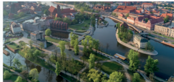
Widok na wyspy: Daliową, Młyńską, Stodową, Tamkę, Piasek, fot. ze zbiorów WPM UMW

Bielarska, Daliowa, Młyńska, Stodowa, Tamka oraz Piasek to grupa wysp położonych w historycznym centrum miasta. Oprócz Tamki wszystkie wyspy połączone są dawnymi i współczesnymi mostami i kładkami (kładka Piaskowa, kładka Stodowa, Żabia Kładka). Latem na wyspie Stodowej możesz wziąć udział w imprezie kulturalnej czy koncercie, a także wyciągnąć się na wygodnym leżaku i obejrzeć film w kinie plenerowym. Wyspa Bielarska – z licznymi placami zabaw – to prawdziwy raj dla dzieci, ale i dorośli znajdą tu coś dla siebie: właśnie tutaj cumuje Barka Tumskia, na której znajduje się całoroczna restauracja. Wyspy są również tłem dla sztuki – na Piasku możesz podziwiać kultową rzeźbę Jerzego Beresia, a na Wyspie Daliowej słynną „Nawę” Oskara Zięty. Jeśli interesuje cię hydrotechnika, koniecznie wybierz się na Tamkę, jedną z najmniejszych odrzańskich wysp, gdzie znajdziesz kilka budowli hydrotechnicznych, które są dzisiaj zabytkami budownictwa wodnego XIX w.